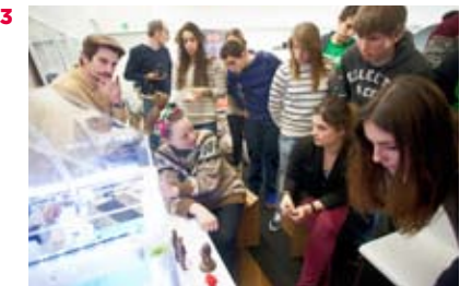
3. Impresora 3D utilizada en el OpenLab.