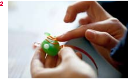
2. Creación con silicona, una de las actividades realizadas en el OpenLab.