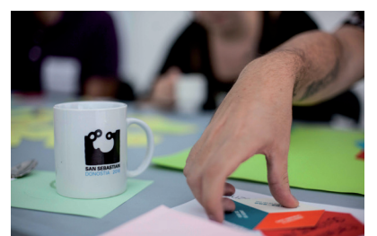
3. Herritarren parte-hartzearekin egindako Amarako kultur jarduera eta premien mapa. 4. Amara Bai Auzo Elkarteko kidea. 5. AuzoLab-aren saioetako bat.

ZER DA AUZOLAB BAT? Beren jarduteak birpentsatu eta komunean jarduteko modu ezberdinak irudikatzeko elkartutako pertsona-talde bati aplikatutako metodologia da. Identifikatutako premientzat erantzunak bilatzeko adimenak elkartzeko desioak batzen ditu eta artista edo sortzaileen (“desberdinak” deiturikoak) laguntza izaten dute. “Desberdinek”, taldeari, aniztasuna eta beste pentsamendu mota bat eskaintzen diote, prozesuak dinamizatzen dituzte eta emaitza sortzeaz arduratzen dira. Ez da ohiko hiritarren parte-hartze prozesua, baizik eta jarduteko esparru berriak bilatu eta ingurunea eraldatzea du xede. Eta hori guztia c2+i/Conexiones improbables-en metodologiarekin eta jarraipenarekin.